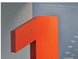
Fachhandwerkspartner Nr. 1 – zum 16. Mal in Folge

Wir schaffen Lebensräume für zukünftige Generationen.