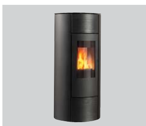
Pelletofen soleo.nrg H10 und V12 Leistung: 2 bis 6 kW oder 2 bis 8 kW