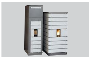
Pelletofen ivo.tec® water+ Nenn-Wärmeleistung: 8, 9 oder 13 kW