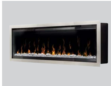
Elektrokamin Feel the flame X

Die Feuersäule Tao ist ein Designobjekt mit faszinierendem, realistischem Flammeneffekt durch innovative Aqua.fire-Technologie. Und durch den praktischen Wassertank wird eine Laufzeit von circa 10 bis 12 Stunden ermöglicht.