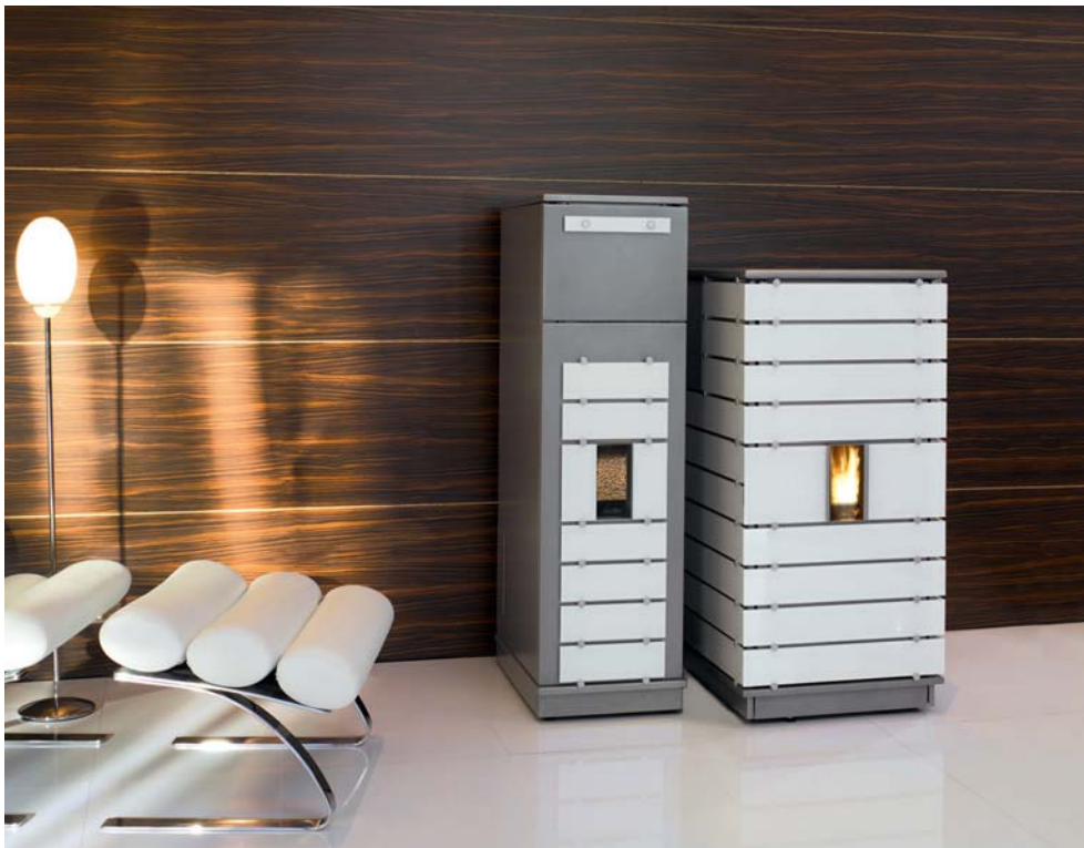
Pelletofen ivo.tec® water+ (im Bild: mit optionalem Pellet-Vorratsbehälter ivo.tower) Nenn-Wärmeleistung: 8, 9 oder 13 kW Einstellbereich 3 bis 8 kW, 3 bis 9 kW oder 3 bis 13 kW Raumheizvermögen: min. 60 m 2 /max. 260 m 2 Rauchrohranschluss nach hinten Ø 100 mm

Beim Kamin- und Pelletöfen-Test für Pelletöfen mit Wasseranschluss der Stiftung Warentest wurde der wasserführende Pelletofen wodtke ivo.tec® water+ Testsieger der Stiftung Warentest 11/2011 (19 Kamin- und Pelletöfen) – Effizienzsieger (1,0), Gesamtnote GUT (1,8).