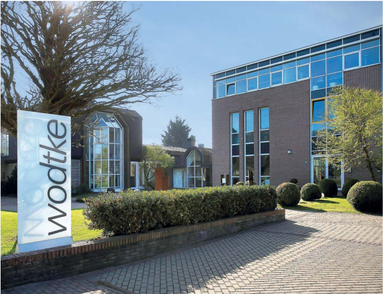
wodtke – gegründet 1964 – ist ein schwäbisches Unternehmen mit Sitz in Tübingen.