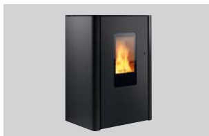
Pelletofen Jack water+ Nenn-Wärmeleistung: 8 oder 10 kW