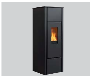
Pelletofen family.nrg selection Leistung: 2 bis 6 kW oder 2 bis 8 kW