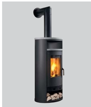
Kaminofen Momo water+ Nenn-Wärmeleistung: 8 kW

Der wasserführende Kaminofen von wotke hat einen sehr hohen Wirkungsgrad von bis zu über 85 Prozent und entfaltet sein Potenzial optimal auch in Kombination mit einer Solaranlage, einer Photovoltaik-Anlage oder einer Wärmepumpe. Diese aus energetischer Sicht sehr effizienten Kombinationsmöglichkeiten verschiedener Energiequellen können dabei helfen, die Heizkosten auf ein Minimum zu reduzieren. Thermische Ablaufsicherung, Tauchhülse, Entlüfter, Füll- und Entleerhahn sind in unserem wasserführenden Kaminofen schon integriert und ermöglichen einen optimalen und sehr sicheren Betrieb.