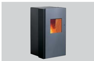
Pelletofen Frank water+ Nenn-Wärmeleistung: 8 oder 10 kW