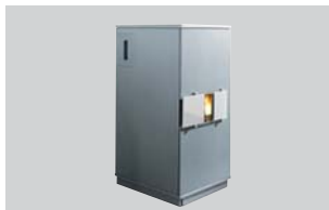
Pelletofen ivo.safe® water+ Nenn-Wärmeleistung: 8, 9 oder 13 kW

Der Brennraum eines raumluftunabhängigen Pelletofens mit DIBt-Zulassung ist absolut luftdicht. Der benötigte Sauerstoff wird bei einem raumluftunabhängigen Pelletofen nicht aus dem Aufstellraum, sondern über eine nach außen angeschlossene Verbrennungsluftzuführung beziehungsweise über einen Abgas-Luft-Schornstein der Verbrennung zugeführt. Ein raumluftunabhängiger Pelletofen mit DIBt-Zulassung ist daher ideal für den Einbau in sehr dichten Gebäuden wie Niedrigenergie- oder Passivhäuser in Kombination mit einer kontrollierten Wohnraumlüftung/ Lüftungsanlage geeignet.