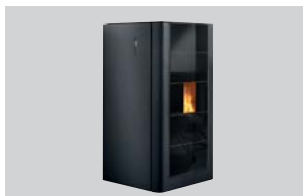
Pelletofen ivo.smart water+ Nenn-Wärmeleistung: 8, 9 oder 13 kW