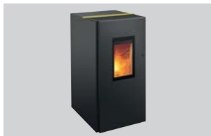
Pelletofen Pat water+ Nenn-Wärmeleistung: 8 oder 10 kW