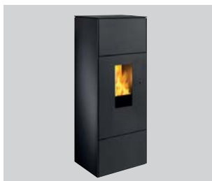
Pelletofen Shogun Leistung: 2 bis 6 kW oder 2 bis 8 kW

Hoher Wirkungsgrad bei gleichzeitig niedrigsten Emissionswerten, herausragende Verarbeitungsqualität und zukunftsorientierte Technologie als Feuerstätten für raumluftunabhängige Betriebsweise – wie alle wotke Modelle selbstverständlich ganz konventionell auch raumluftabhängig zu betreiben.