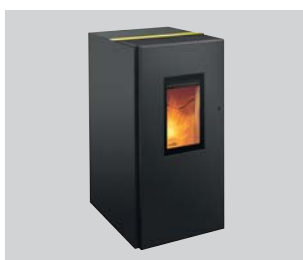
Pelletofen Pat selection Nenn-Wärmeleistung: 2 bis 8 kW oder 2 bis 10 kW