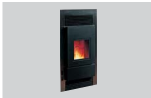
Pelletofen PE Nova water+ Einbaugerät Nenn-Wärmeleistung: 8 oder 10 kW